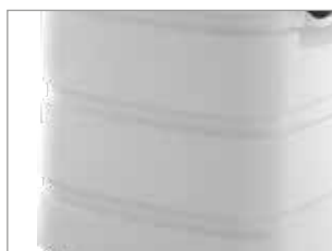
SEHR STOSSFESTER KUNSTSTOFFTANK