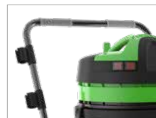
WAGEN MIT GRIFF