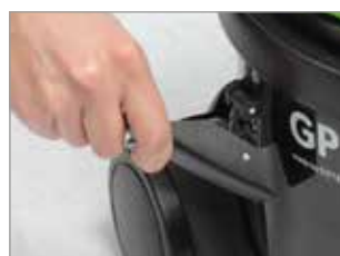
SEHR FLEXIBLE HAKEN