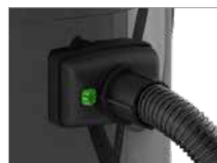
DER FLEXIBLE SCHLAUCH IST FEST UND VERLÄSSLICH VERANKERT