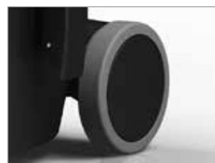
RÄDER MIT GUMMIBELAG