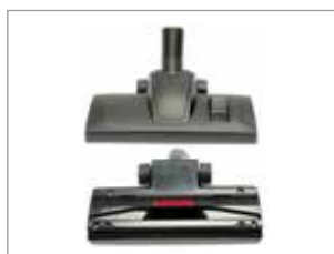
NEUE STARKE DÜSE FÜR HOHE REINIGUNGSEFFIZIENZ