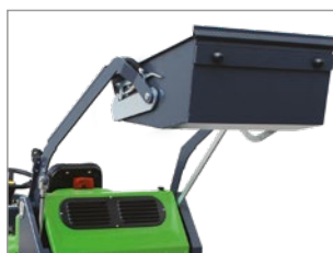
SISTEMA HIDRÁULICO DE DESCARGA DEL DEPÓSITO