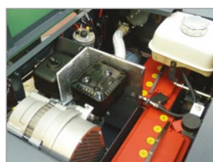
DUAL POWER (1280 DP-P)