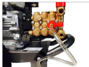
DOTADO DE EYECTOR DE DETERGENTE REGULABLE