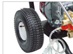
RUEDAS GRANDES Y ANCHAS, ADECUADAS PARA CUALQUIER SUPERFICIE