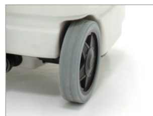
RUEDAS GRANDES CON BANDA DE GOMA