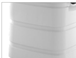
DEPÓSITO DE PLÁSTICO ALTAMENTE RESISTENTE