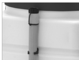
MANGUERA DE DRENAJE