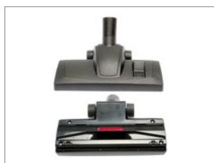
NUEVA BOQUILLA CON ALTA EFICACIA DE LIMPIEZA