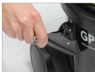
GANCHOS MUY FLEXIBLES