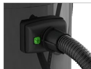
LA MANGUERA SE FIJA DE FORMA FIABLE Y SEGURA