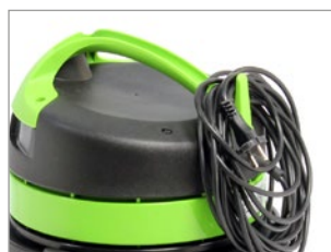
GANCHO PARA CABLE