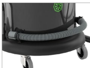
MANGUERA DE DRENAJE