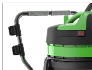
DEPÓSITO CON ASA