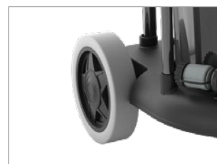
RUEDAS DE GRAN DIMENSIÓN