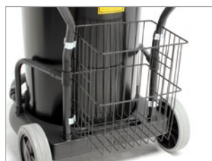
PORTACCESORIOS INDUSTRIAL (OPCIONAL)