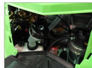
DEPÓSITO DEL DESINCRUSTANTE DE FÁCIL ACCESO