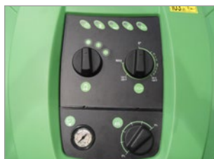
PANEL DE CONTROL CON INDICADORES LUMINOSOS