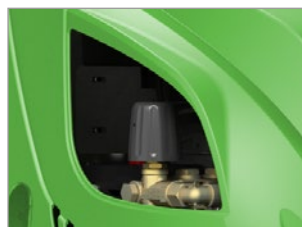
REGULADOR DE PRESIÓN DE LA VÁLVULA DE DESCARGA EN EL MODELO