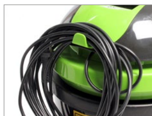
GANCHO PARA CABLE