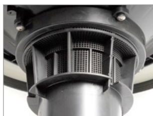
SISTEMA ANTIESPUMA INTEGRADO