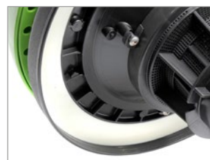
JUNTA INNOVADORA EN EL CABEZAL