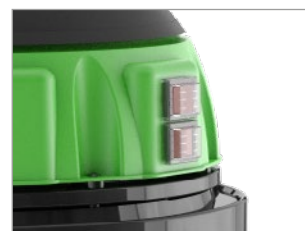
INTERRUPTORES CON INDICADOR LUMINOSO