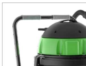
DEPÓSITO CON ASA