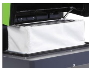
FILTRO DE PANEL