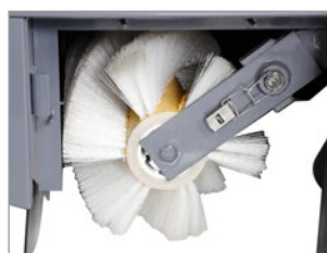
HERRAMIENTAS NO NECESARIAS PARA SUSTITUIR CEPILLO CENTRAL