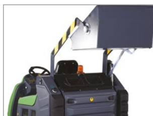
SISTEMA DI SCARICO CON PISTONE IDRAULICO