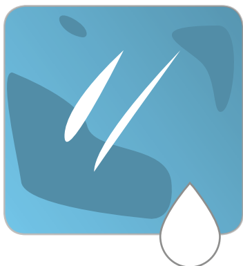
Acqua ad elevata durezza

Se utilizziamo ACQUA CON UN'ELEVATA DUREZZA per la pulizia dei vetri, su quest'ultimi rimarranno molti aloni e il vetro NON SARÀ PERFETTAMENTE TRASPARENTE .