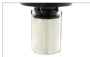
CARTUCCIA ULPA U15 CON TEST DI INTEGRITÀ