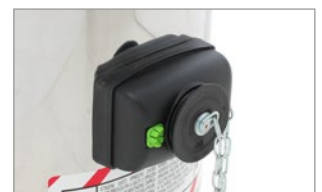
TAPPO DI SICUREZZA INTEGRATO