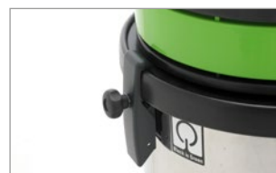
BLOCCO DEI GANCI DI CHIUSURA PER UN TRASPORTO STABILE