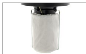
PREFILTRO IN POLYCARBON