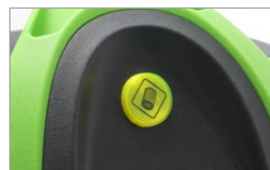
SPIA LUMINOSA DI SICUREZZA