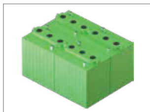
AMPLIO COMPARTIMENTO PARA 4 BATERÍAS DE 6 V