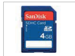
TARJETA DE MEMORIA