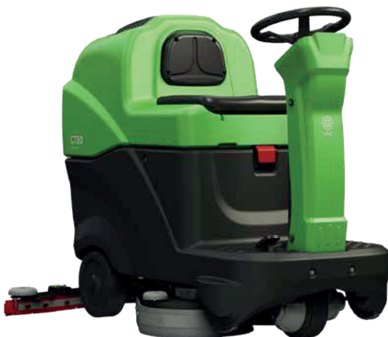
VERSIÓN CON UN CEPILLO