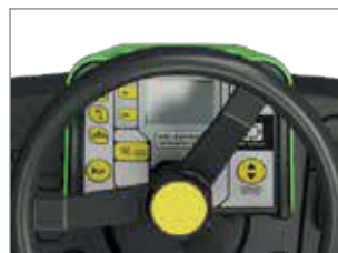
PROGRAMAS DE TRABAJO PREDEFINIDOS