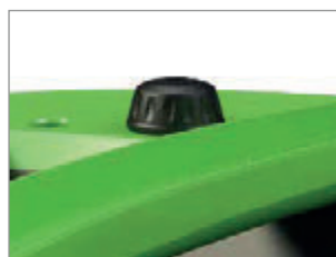
REGULADOR DE VELOCIDAD