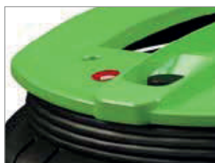
INDICADOR DE SATURACIÓN DEL FILTRO